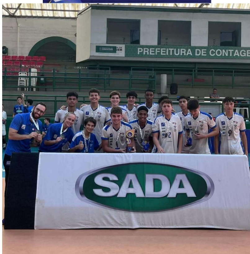
Vice Campeão da Copa SADA

Av. Julio Diniz, 470 – Jd Nossa Senhora Auxiliadora - CEP 13075-420 - Campinas- SP Brasil CNPJ Nº 10.157.375/0001-13 (19) 3756-4049 - brasilvoleiclube@terra.com.br www.voleirenata.com.br